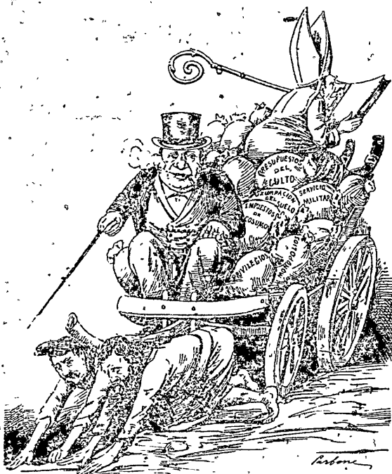
Al clero se le hace un lugarcito en el carro para que predique a los proletarios que tiran: ganarás el pan con el sudor de tu frente.

Casi media columna está destinada a cri-